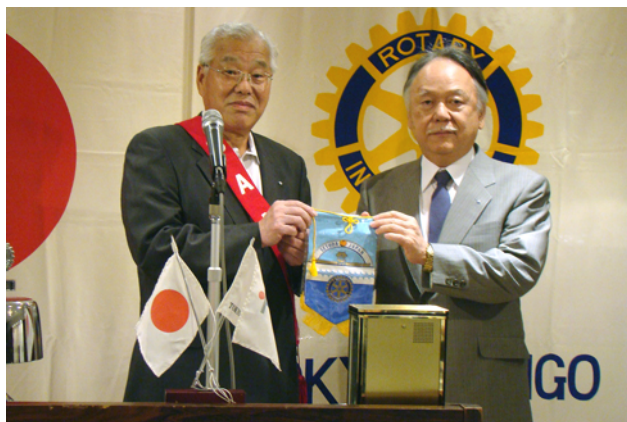
魚崎会員が瀬戸田 RC へメークアップし、 バナー交換をしました。

ROTARY ROTARY ROTARY ROTARY ROTARY ROTARY ROTARY