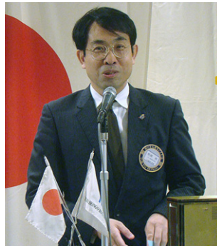
松岡クラブ奉仕委員長