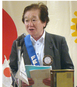
伊藤親睦活動委員長