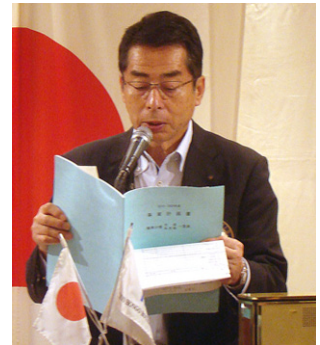
米倉プログラム委員長