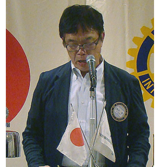
熊井会員増強委員長