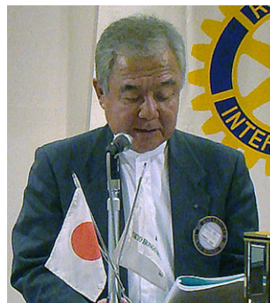
柴山職業分類委員長