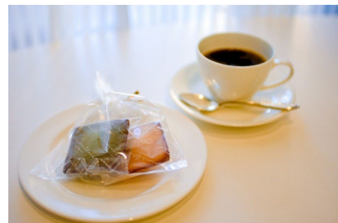
フィナンシェ・コーヒー イメージ写真